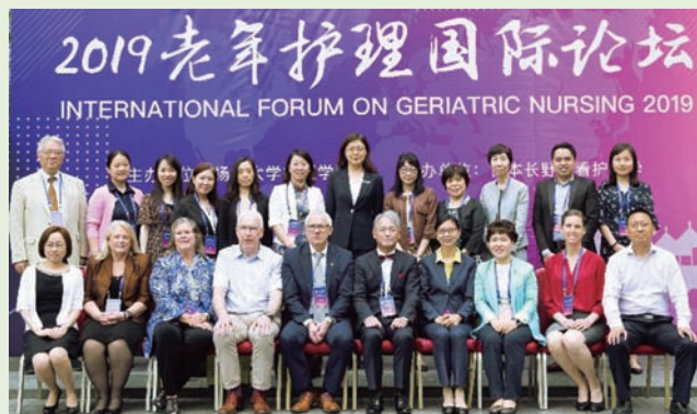
At the International Forum on Geriatric Nursing 2019. 2019老年看護国際フォーラムにて。