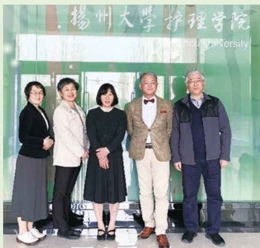
At Yangzhou University. 揚州大学にて。