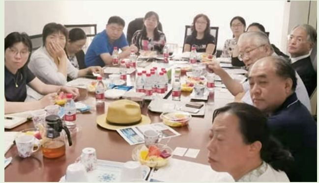
Meeting with the members of the Nursing Subcommittee. 中国医療保健国際交流促進会看護分会のメンバーと。

Japan and introduced a remote nursing system named Salus Vision. (En Takashi)