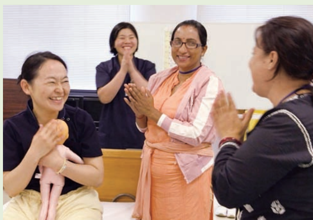
Nepali trainees and teaching staff smiled at the birth of model baby! 演習の中で児の誕生に笑顔！