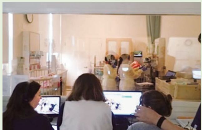
A practice room imitating a sickroom viewed from the control room of the USF Simulation Center. USFシミュレーションセンターのコントロール室からみた病室を模した演習室の様子。

Academic staffs of both universities as well as education researchers supported us in many situations. This is why we produce fruitful results in such a short period of time. We would like to express our gratitude to all of them. (Kieko Yasuda)