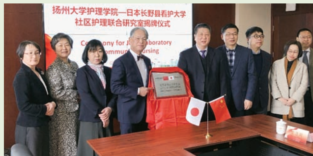
Opening ceremony of Joint Laboratory for Community Nursing.

(NCN), and attended the opening ceremony of Joint Laboratory for Community Nursing.