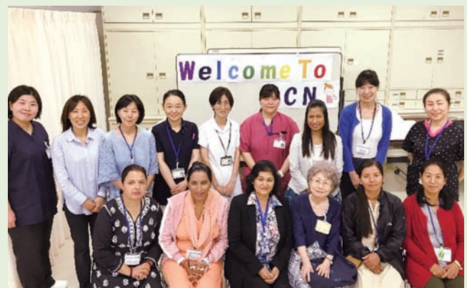
Nepali trainees visited Nagano College of Nursing. ネパールからの研修生が長野県看護大学を訪れました。